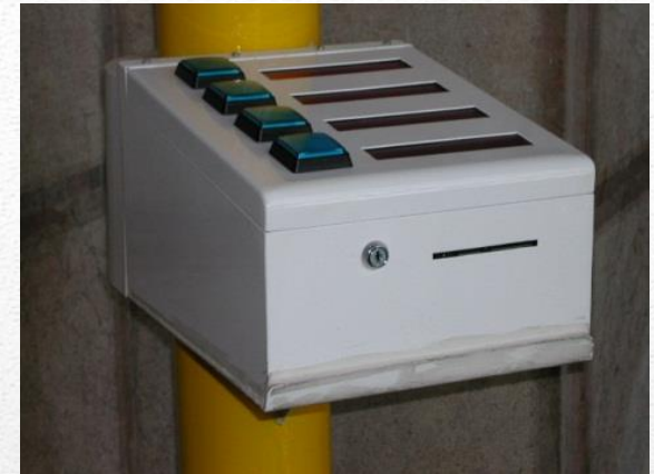
MECHANICAL INTERFACE PRINTERS