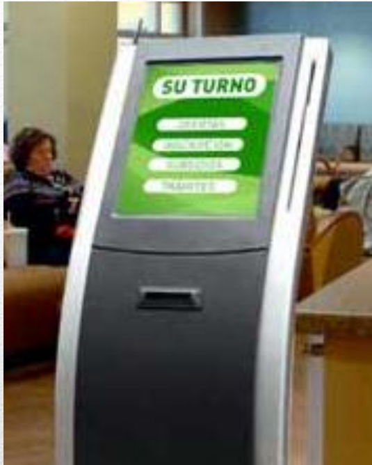
TOUCH INTERFACE PRINTERS