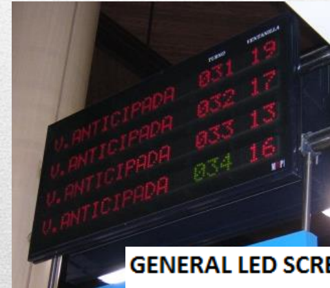
GENERAL LED SCREEN - PER TYPE