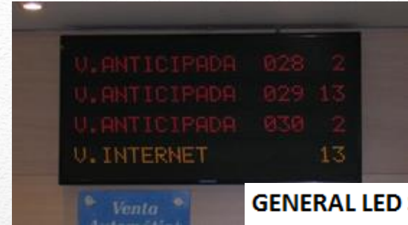
GENERAL LED SCREEN - CHRONOLOGIC