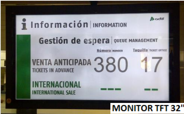
MONITOR TFT 32"